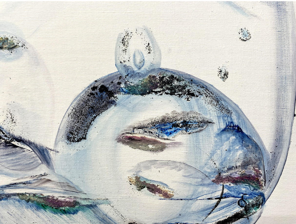
Sans titre , Peinture à l'huile et collage de sable, 100x65 cm