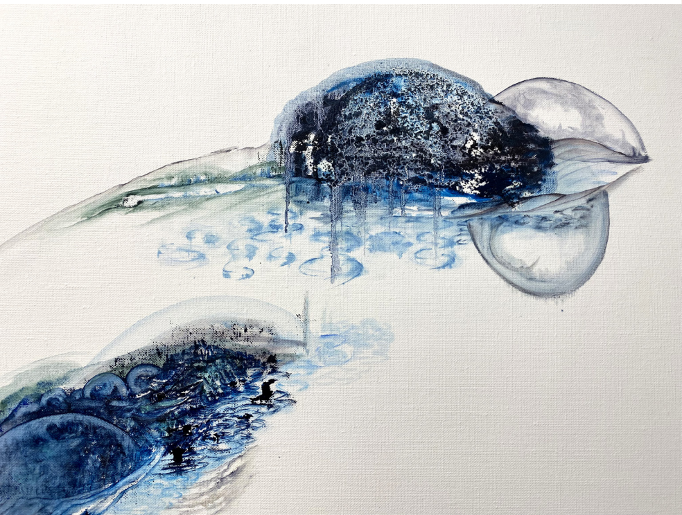
Sans titre , Peinture à l'huile et collage de sable, 100x81 cm