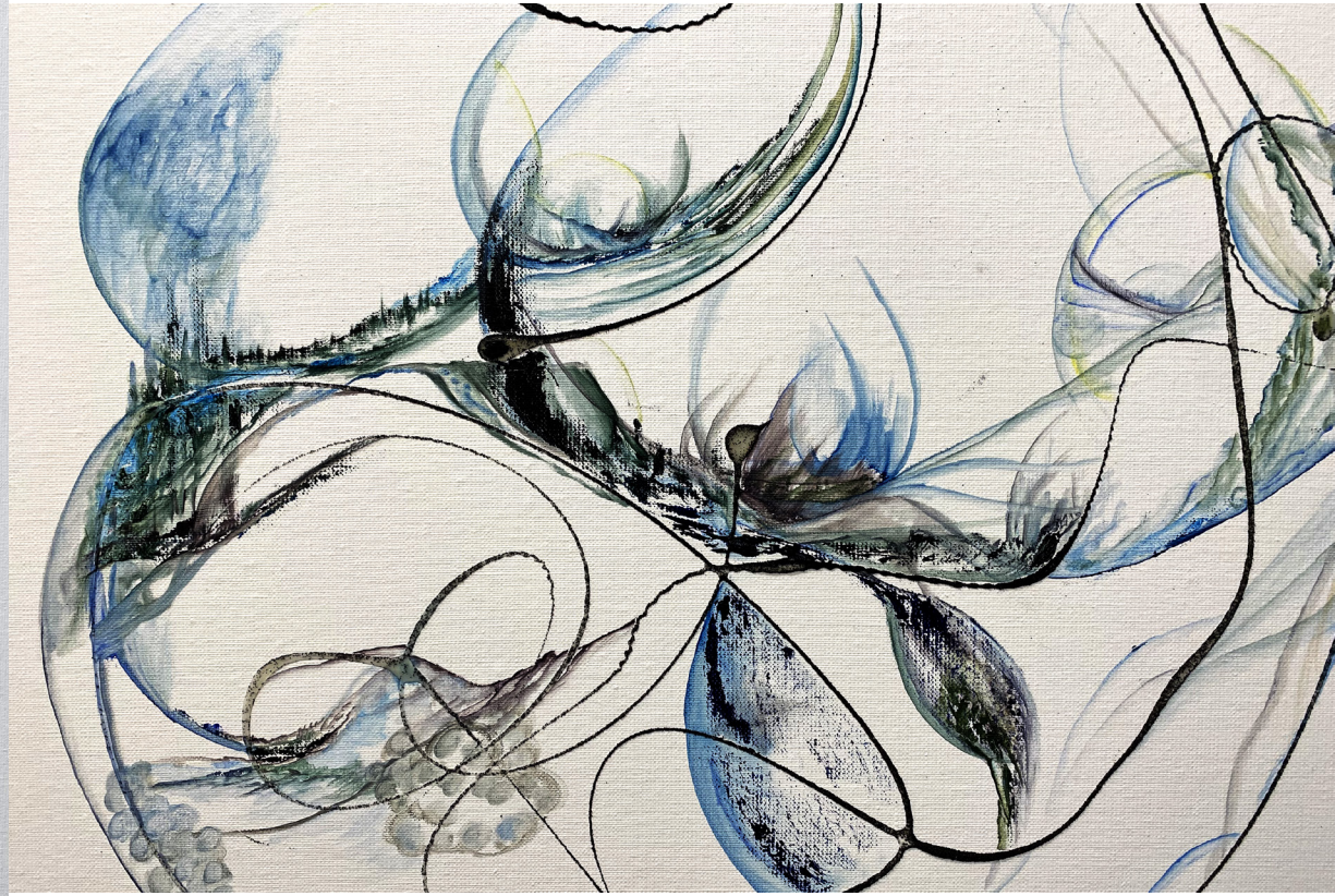
Sans titre , Peinture à l'huile et collage de sable, 100x65 cm