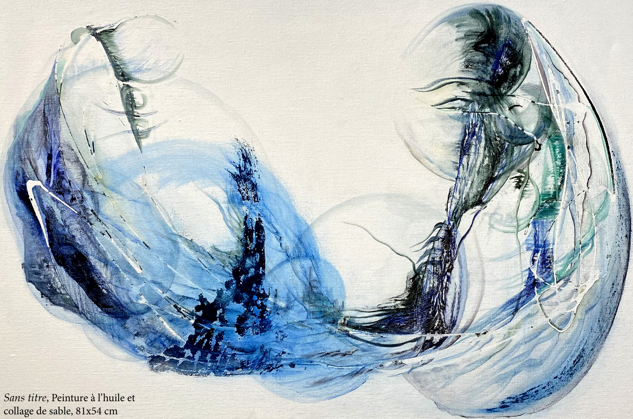
Sans titre , Peinture à l'huile et collage de sable, 81x54 cm