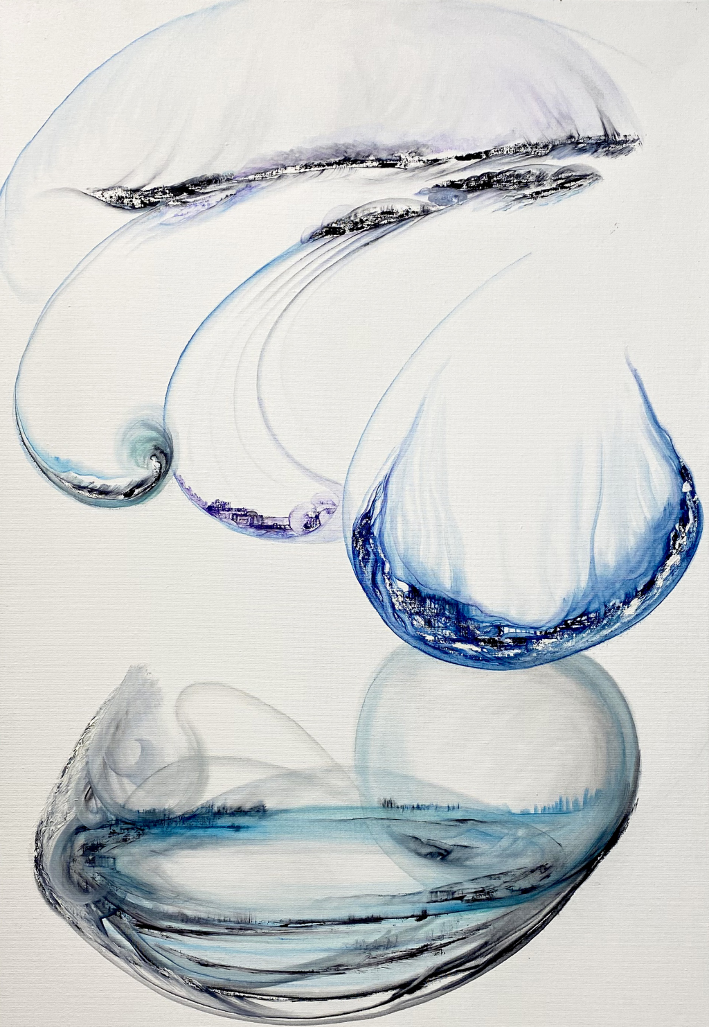
Sans titre , Peinture à l'huile et collage de sable, 100x65 cm