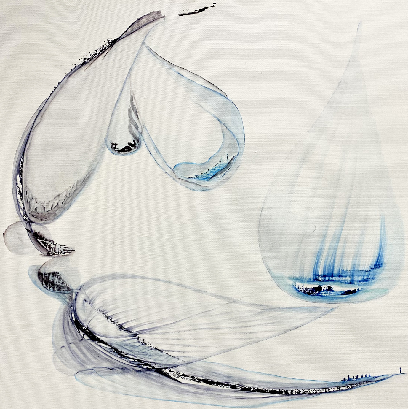
Fragilité , Peinture à l'huile, 50x50 cm