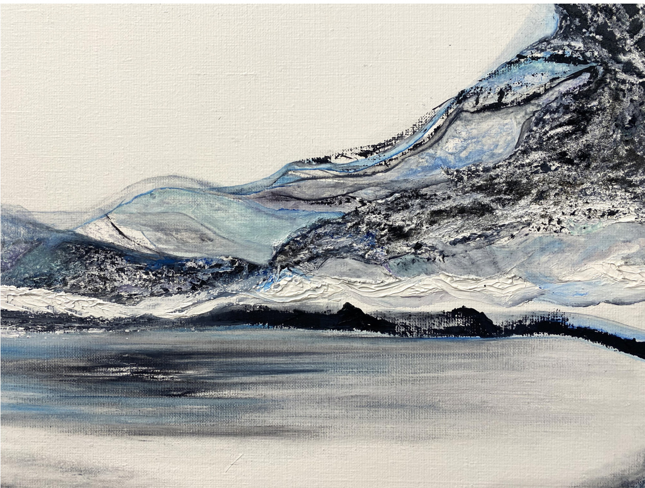
Le premier jour , Peinture à l'huile et collage de sable, 116x73 cm