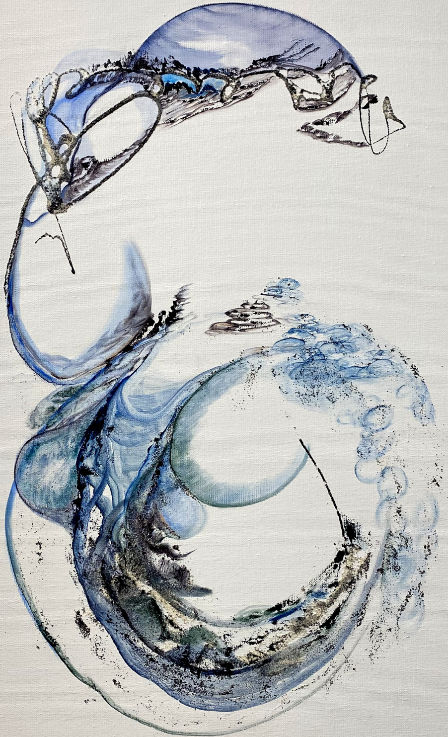
Sans titre , Peinture à l'huile et collage de sable, 65x46 cm